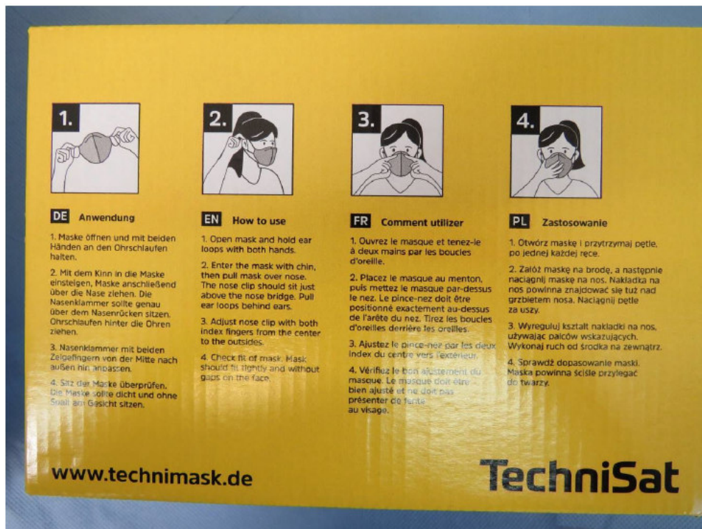
Bild 1 Gebrauchsanweisung des Herstellers auf dem Karton