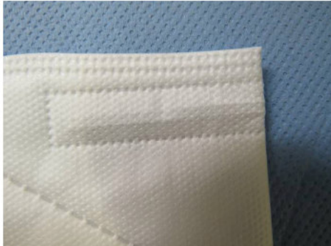
Bild 7 Nasenbügel