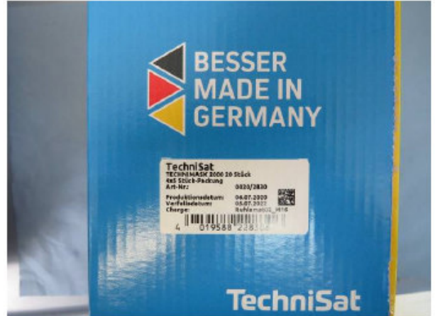
Bild 2 Verpackung der Probekörper