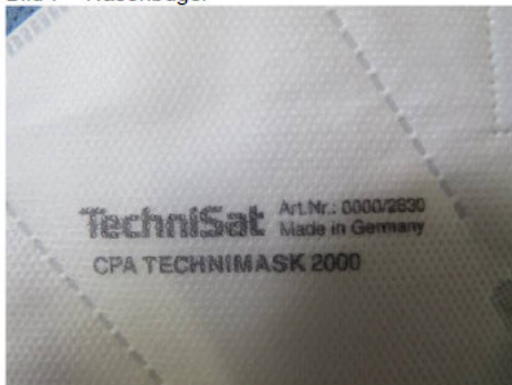
Bild 9 Aufschriften / Aufdrucke am Probekörper