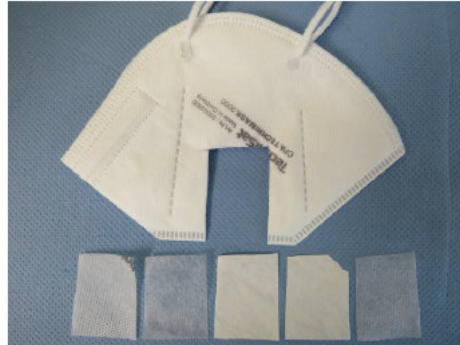
Bild 8 Atemschutzmaske aufgetrennt