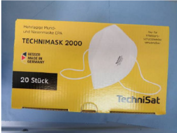
Bild 1 Verpackung der Probekörper