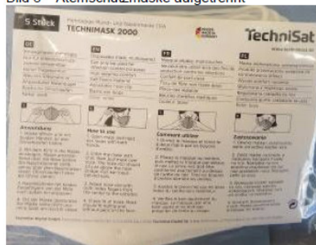
Bild 10 Beipackzettel